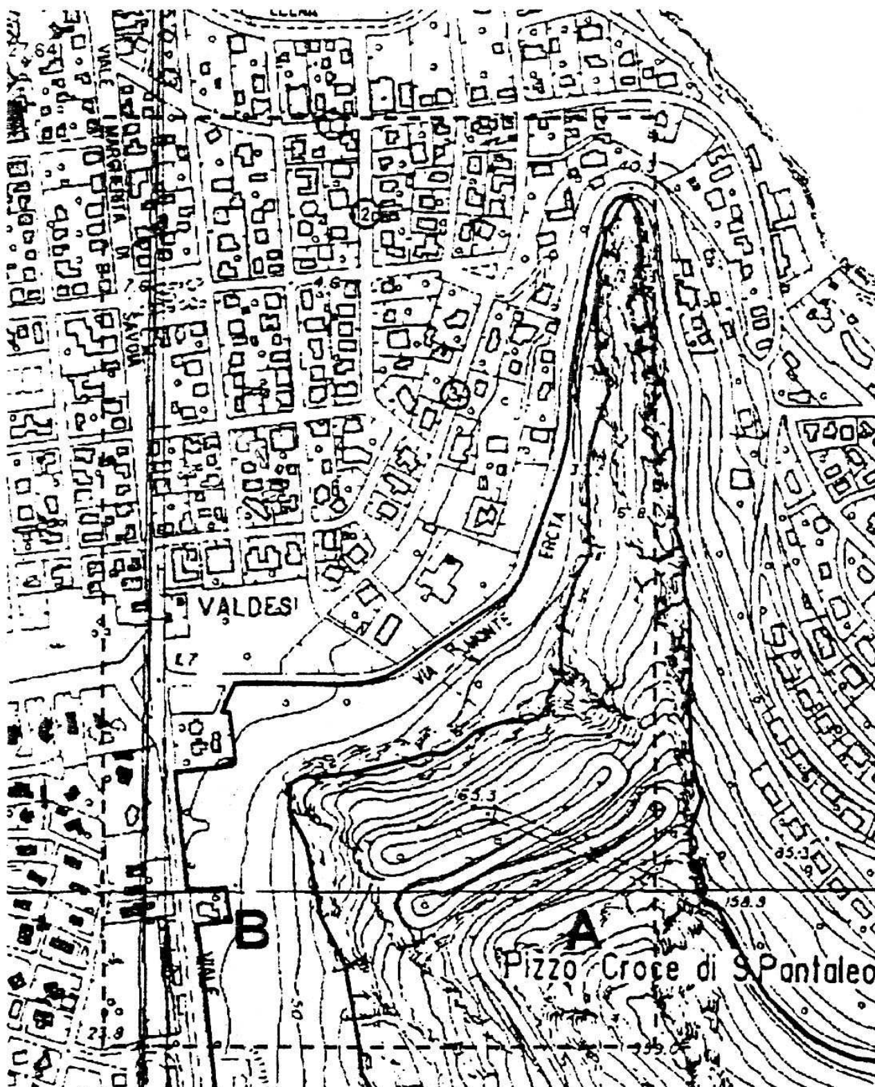
Particolare in scala 1:10.000 dell'area modificata con decreto n. 945 del 4 agosto 2003